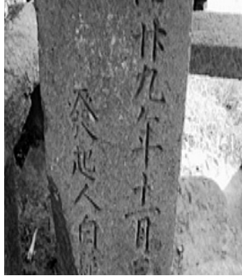
写真3 腰掛石の発起人