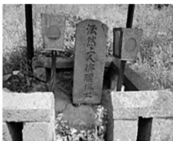
写真1 法然上人腰掛石の石碑

「法然の腰掛石」を検証する前に、まず法然の出自について、古文書からの引用を行なう。『作陽誌(全六巻)』は美作国の後年の近世森家の支配下で編集された歴史書であり、松平藩となつてからの東作誌と併せて、同地の自然、寺社など地域事情を網羅した包括的歴史書である。『作陽誌』は「西作誌」と「東作誌」に別れ、前者は漢文白文、後者は「かなかな」交じりの漢文で書かれている。この『作陽誌』によって法然の出自を訪ねるところから始めよう。古文(書き