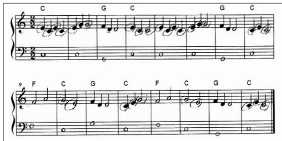
図2** 学生Bによる伴奏付け

*図1のメロディ譜の音符についている○は、学生が教員の指示に従って自身で和声音を探し出して印をつけたものである。